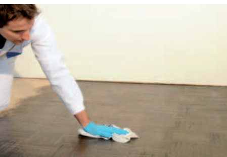
RETIRER LE SURPLUS