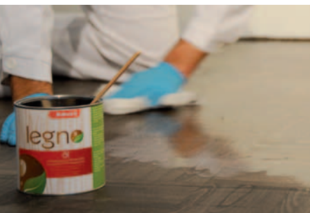
RÉPÉTER LE PROCESSUS AVEC L'HUILE OU L'HUILE- CIRE LEGNO