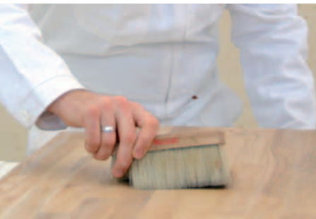
RETIRER LA POUSSIÈRE ET LA SALETÉ