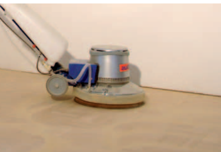
PONCER LE SOL