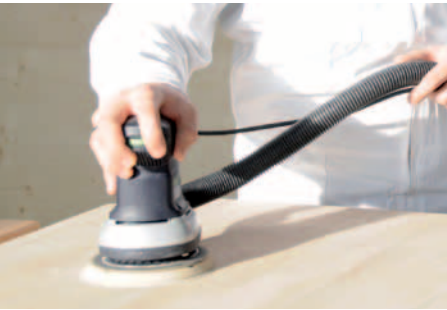
PONCER LES SUPERFICIES