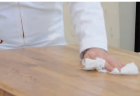
RETIRER LE SURPLUS