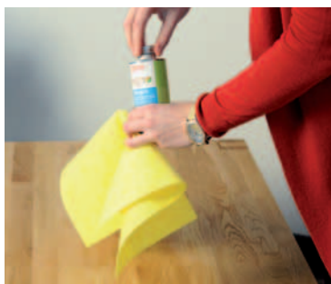
UNE COUCHE FINE SUFFIT