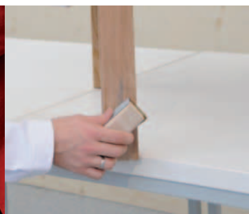
PONCER LES SURFACES ÉGRATIGNÉES